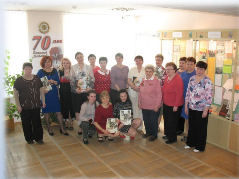
Сотрудники ЦДНИРО на открытии выставки «Нас матери родные ждут с Победой!» 8 мая 2015 года