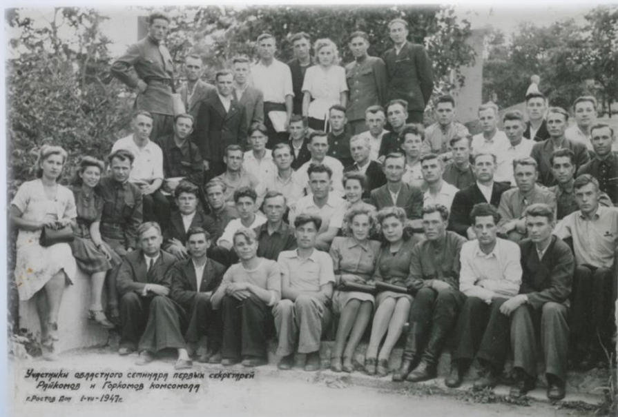
Участники областного семинара первых секретарей райкомов и горкомов комсомола г. Ростов-на-Дону 1-июль-1947г.