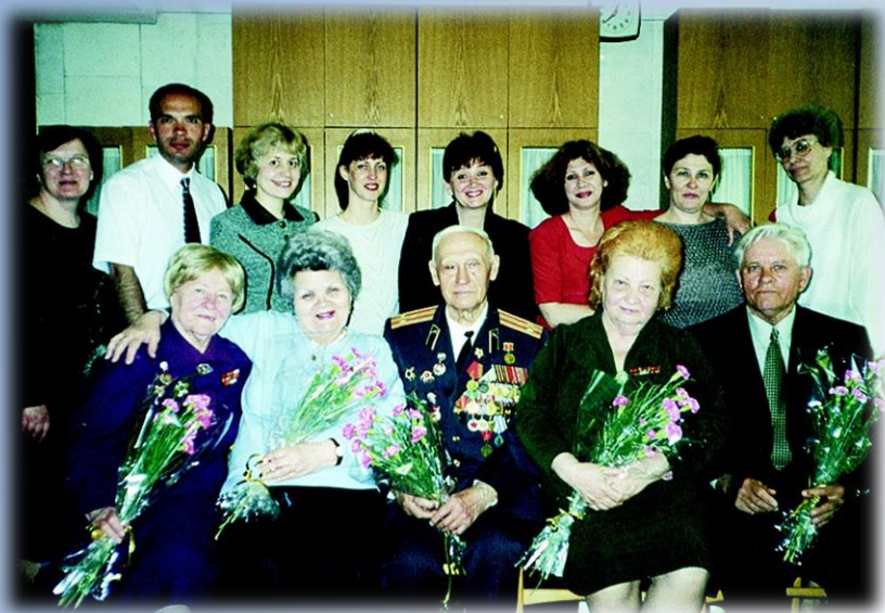
Золотой фонд ЦДНИРО. Май 2001 год